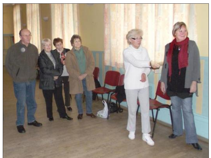
■ Une partie de bowling par télécommande interposée.

parfois des adultes bien mûrs se tenir l'épaule qu'ils ont martyrisée en jouant virtuellement au tennis !