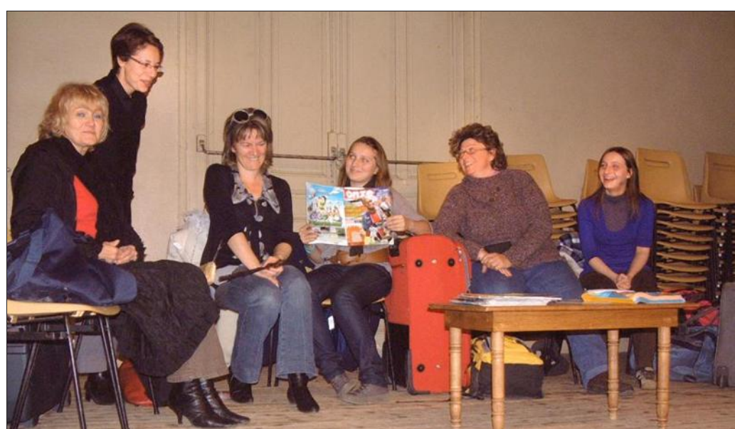
■ Six jeunes femmes talentueuses.

« Embarquement non immédiat », samedi 13 novembre à 20 h 30 et dimanche 14 novembre à 15h, salle des fêtes. Entrée 3 €. Réservations au 03.29.86.61.79 de 18 à 20 h.