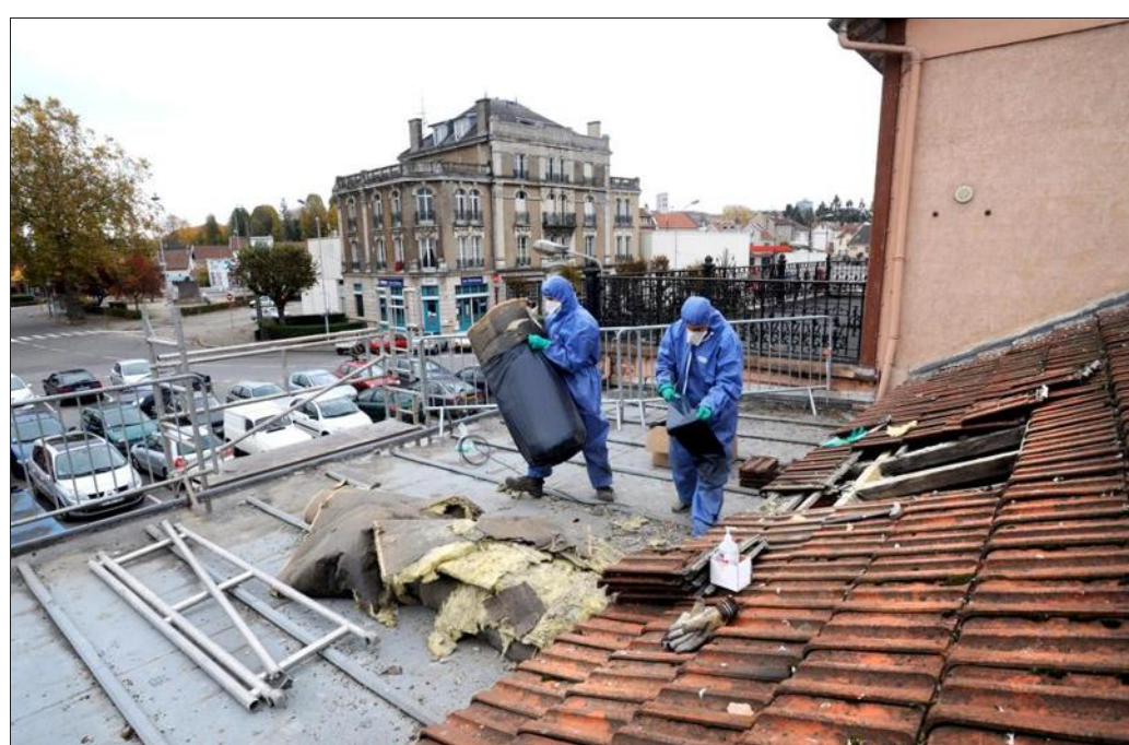
P.L. ■ Les techniciens de LPH utilisent une combinaison de protection.

Ce chantier vient de s'achever et il devrait faire bon cet hiver dans le hall de la gare.