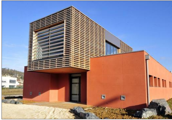
■ L'exposition consacrée à l'éco-construction se tiendra à l'espace culturel jusqu'au 17 avril.

L'objectif premier de l'exposition est de sensibiliser un large public à l'éco-habitat. Récit d'un voyage de dix-huit mois sur le thème de l'éco-habitat, à la rencontre d'hommes et de femmes qui mettent en œuvre des solutions concrètes à leur échelle, l'exposition évoque le parcours de deux géographes dans une ambiance sonore de voyage et de chantiers. Elle illustre par des expériences vécues sous d'autres latitudes les grands principes de la construction écologique en présentant des matériaux simples, disponibles et faciles à utiliser, ainsi que des façons d'habiter différentes, à travers des