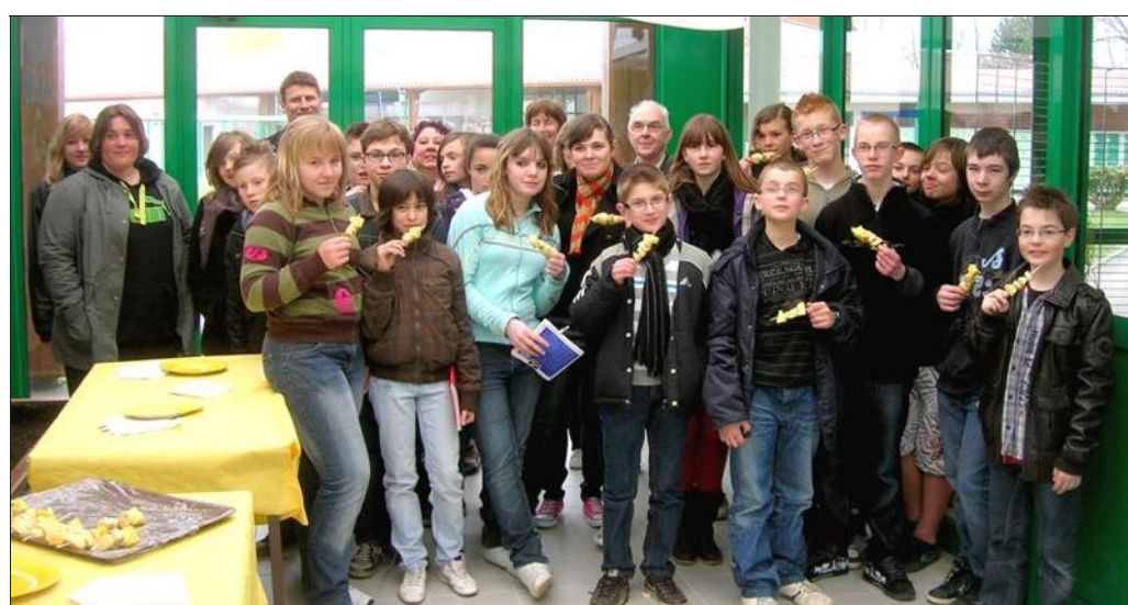
■ Pratiquer une activité physique et consommer chaque jour des fruits et légumes, de bonnes habitudes à prendre pour éviter les maladies cardiovasculaires.