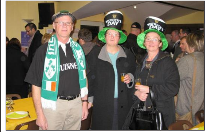
■ Le jour de la Saint-Patrick, les participants prennent soin de porter au moins un vêtement avec du vert, symbole de l'Irlande.

Lors de cette soirée, les participants, qu'ils soient chrétiens ou pas, portent généralement au moins un vêtement avec du vert, assistent à des parades, consomment des plats et des boissons irlandaises. Une belle occasion de se réunir entre amis ou en famille pour passer une agréable soirée où règnent bonne humeur et convivialité.