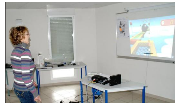
■ Les mouvements se pratiquent en douceur et toujours dans la bonne humeur.

Il est temps de commencer les exercices. Le premier demande agilité et réflexion. Il faut en effet taper « virtuellement » en basculant le bassin de droite à gauche et d'avant en arrière, sur des petits champignons dotés de chiffre pour obtenir le résultat de 10. Calcul mental avec additions et soustractions au programme. Le parcours aé-