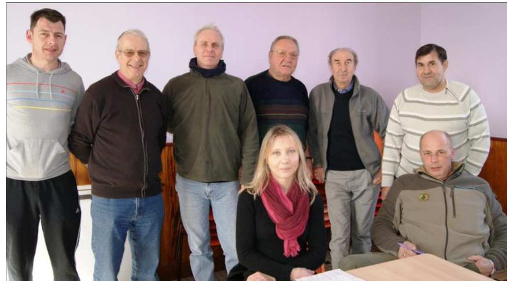
■ L'assemblée générale de l'association de pêche « La Nausonce » s'est tenue à la salle des fêtes en présence d'une partie des adhérents.

que deux truites par jour d'une longueur minimale de 30 cm. Toute personne inconnue qui serait en train de pêcher sans carte doit être signalée à la gendarmerie de Revigny. Chaque pêcheur peut pêcher cinq jours par semaine et doit posséder sur lui sa carte de pêche. Les adhérents prévoient de procéder à un nettoyage de la rivière sur une ou deux journées afin d'éliminer les branchages qui se trouvent dans le lit du cours d'eau pour améliorer la qualité de la pêche. L'ouverture avec leur aura lieu le 28 mars aux heures habituelles d'ouverture.