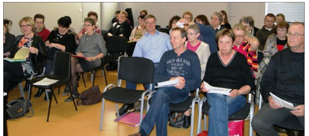
■ Les participants au comité de pilotage de la future épicerie sociale et solidaire représentent les diverses institutions porteuses du projet.

Le comité de pilotage de la future épicerie sociale composée des membres des cinq pôles désignés s'est réuni pour