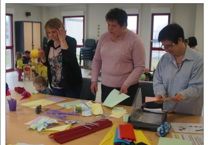
■ Pas facile de reproduire le modèle.

nuel de découpage, pliage, ajustage, collage, très apprécié fut quand même réservé aux adultes et fit l'admiration des enfants qui pendant ce temps s'amusaient avec les jouets mis à leur disposition. Les petits, la séance terminée, n'ont pas manqué de repartir fiers de la réalisation à apporter à leurs parents. Après quelques jours de fin d'hiver au climat très agréable, cette matinée ne fut pas aussi printanière qu'on l'aurait souhaité, le froid s'étant invité.