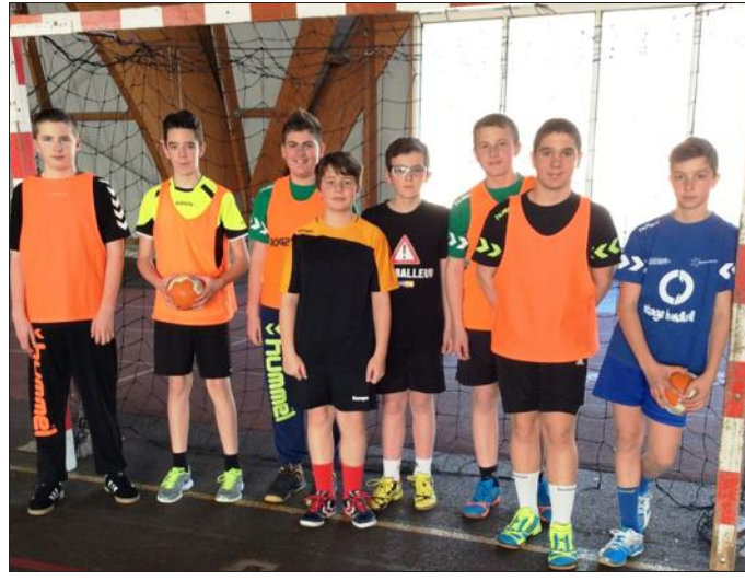
■ L'équipe de handball est vice-championne de Meuse.

Lors du championnat départemental des sports collectifs UNSS, aussi connu sous le nom de « challenge du lait », qui se sont déroulées dernièrement, les performances réalisées par les jeunes sportifs du collège Jean-Moulin ont été remarquables.