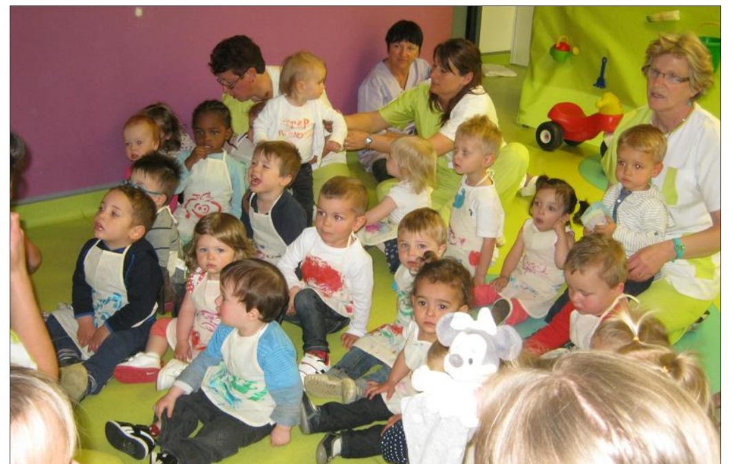
■ Pas toujours facile de chanter en public !

« Nous avons travaillé toute l'année sur le thème du jardin. Les enfants ont fabriqué, avec l'aide de l'équipe pédagogique, de jolis pots de fleurs où ils ont planté des capucines, et les petits tabliers de jardiniers qu'ils