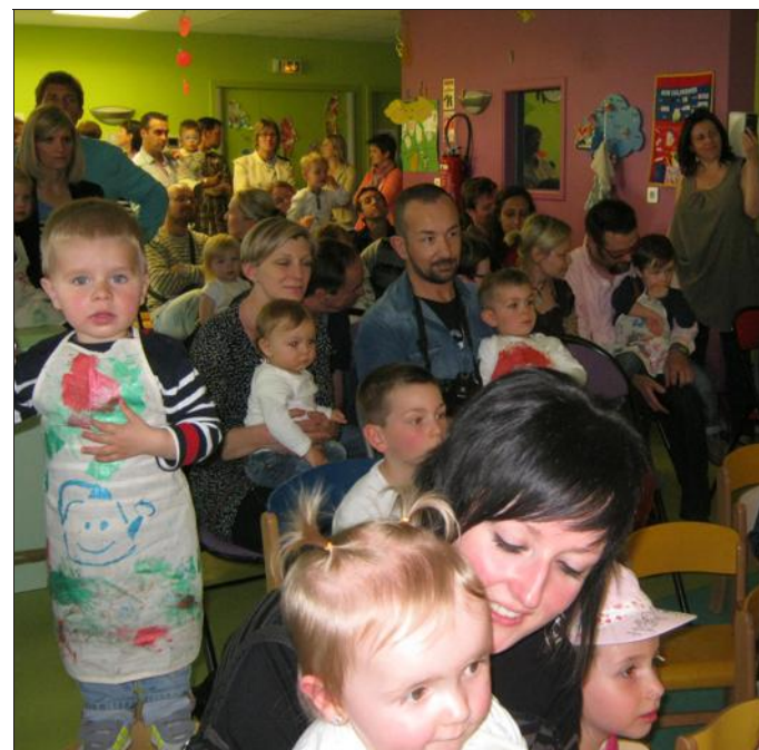
■ Parents et enfants toujours émerveillés.

Dans un décor représentant un jardin, où trônaient les outils nécessaires aux diverses plantations, les petits bouts de chou de la structure multi-accueil des Libellules, âgés de 18 mois à 3 ans, ont accueilli leurs parents et amis en chansons, lors de la petite fête de fin d'année