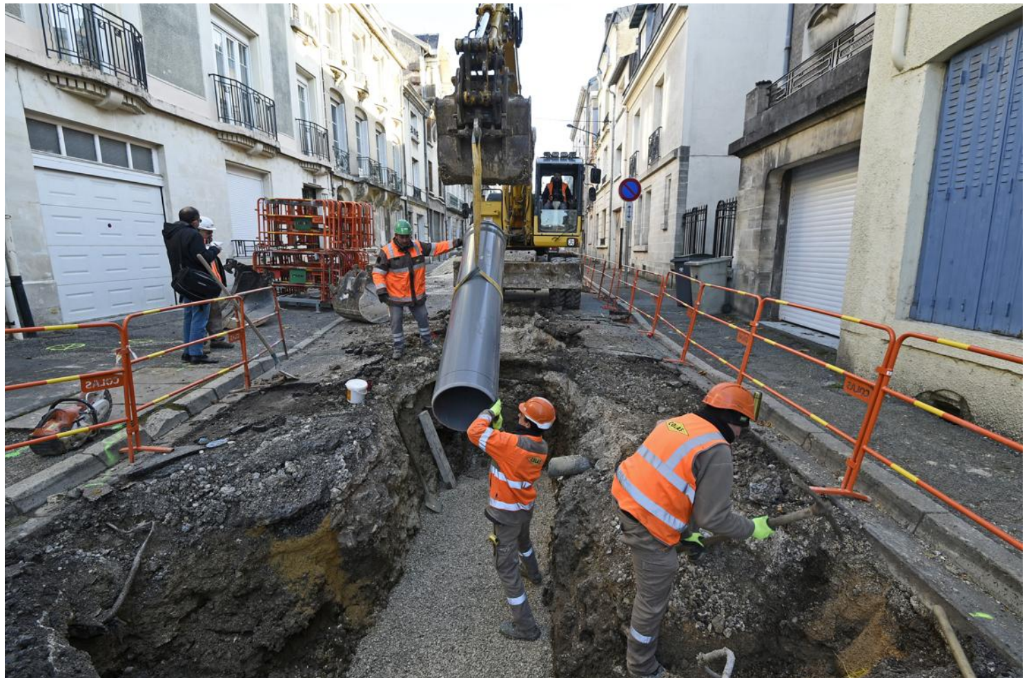
Deux pelleteuses, deux camions de 15 et 20 tonnes et huit ouvriers ont attaqué le chantier de la rue de la 7 e -DB-USA.