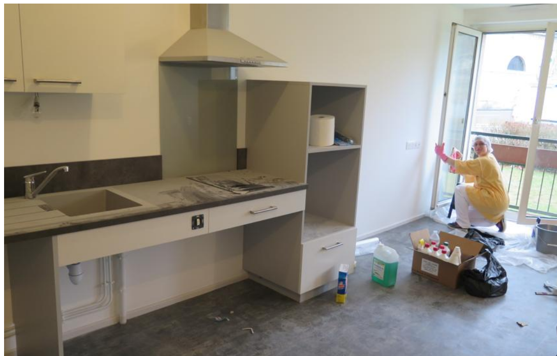
Ce T2 destiné à une personne à mobilité réduite est terminé. Il ne reste plus qu'à le nettoyer et à l'équiper de plaques chauffantes, et d'un four.