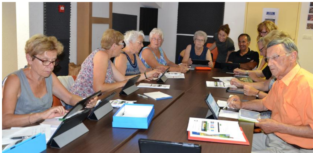
Une formation pour rester connecté à son époque.