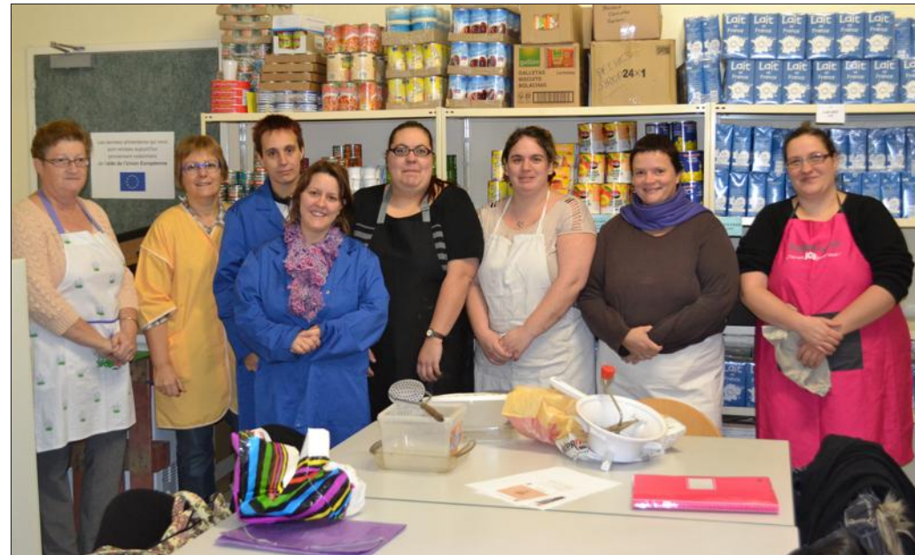
■ L'atelier culinaire a lieu à la salle multifonctions chaque mardi, en dehors des vacances scolaires.

L'équilibre est parfait entre le goût et le respect du budget. Pour les fêtes, il est projeté une soupe potiron-saumon, un vol-au-vent et bien entendu un gâteau de Noël.