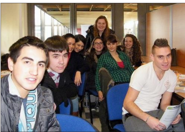
■ Les lycéens se sont fortement mobilisés avec 50 % de nouveaux donneurs.