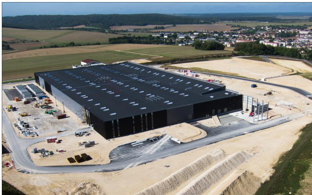
■ Concordia pourrait s'installer dans la ZAE de Seugnon, à côté de Safran.