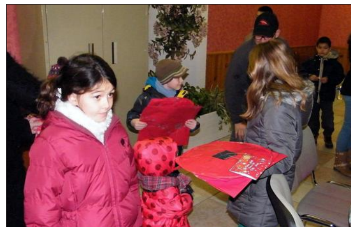
■ Derniers préparatifs à la mairie avant l'envoi des lanternes volantes.