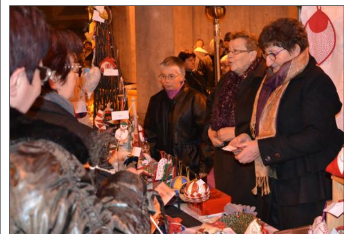
■ Un patchwork de mille couleurs sur le marché de Noël.

C'est bien au chaud sous les halles fermées pour l'occasion que s'est tenu le traditionnel marché de Noël, organisé par la Fédération Vidusienne.