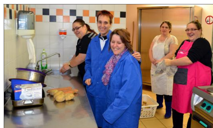
► Un nouvel atelier culinaire s'est mis en place à la salle multifonctions.

La campagne officielle des Restaurants du Cœur a débuté fin novembre 2013, et l'antenne locale de l'association lancée par Coluche en 1985 a malheureusement elle aussi de plus en plus de « succès » ; C'est ce qu'a constaté la vingtaine de bénévoles lors de la pose de leur distribution hebdomadaire : « Nous sommes déjà à 37 familles inscrites, contre 26 l'an dernier à la même époque... Les mouvements