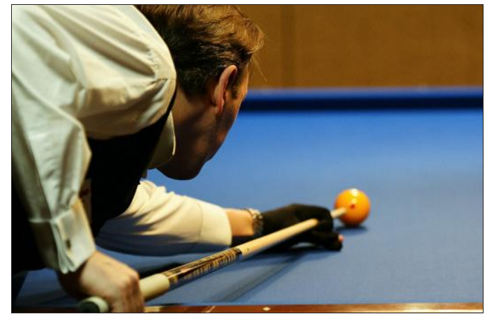
► Le prochain tournoi de billard trois bandes, se produira à Commercy, les samedi 8 et dimanche 9 février prochain.

commercien. A noter également la 6e place de Charlot-Gérard, dernièrement à Laxou (54), et diverses autres rencontres, dont la dernière poursuite du championnat en équipes avec le club de Saint-Dizier, qui s'est déroulée à Commercy le vendredi 20 décembre dernier. A rappeler aussi, que le prochain tournoi de billard trois bandes, se produira à Commercy, les samedi 8 et dimanche 9 février prochain ;