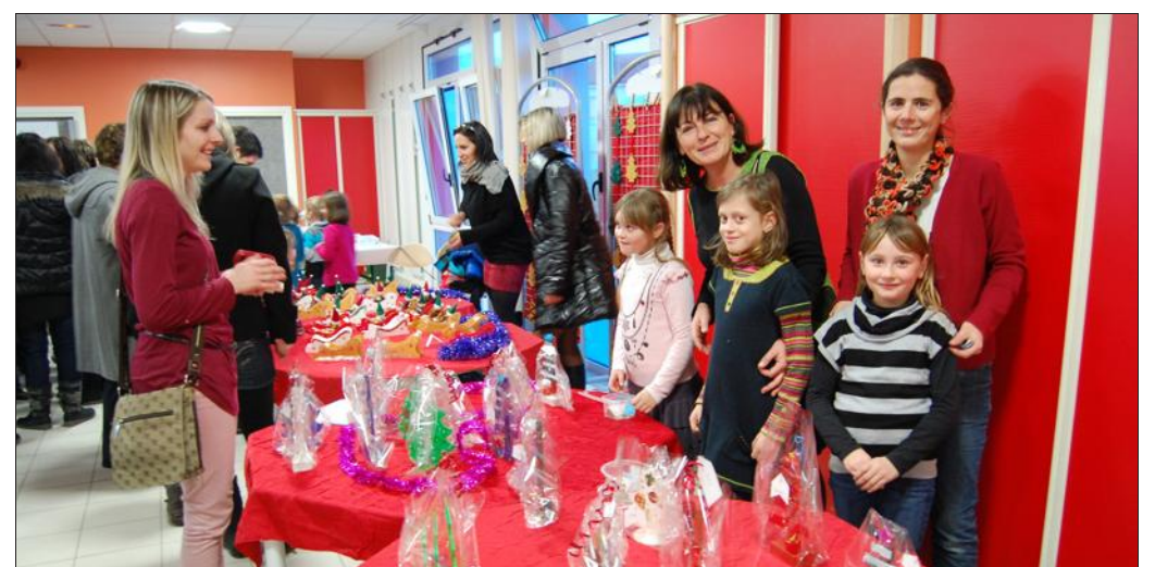
► Les élèves ont créé de superbes décors aux couleurs de Noël.

sympathique artisan local, qui a fourni de nombreux supports aux décors de table et de sapin de Noël. Les parents se sont mis au diapason, en confectionnant de succulentes gaufres et crêpes qui ont été bien vite englouties. Le but de ce marché de Noël était de gonfler la cagnotte de la coopérative de l'école pour offrir un voyage au parc de Sainte-Croix au printemps, mais aussi de créer du lien dans cette nouvelle école. Double mission réussie !