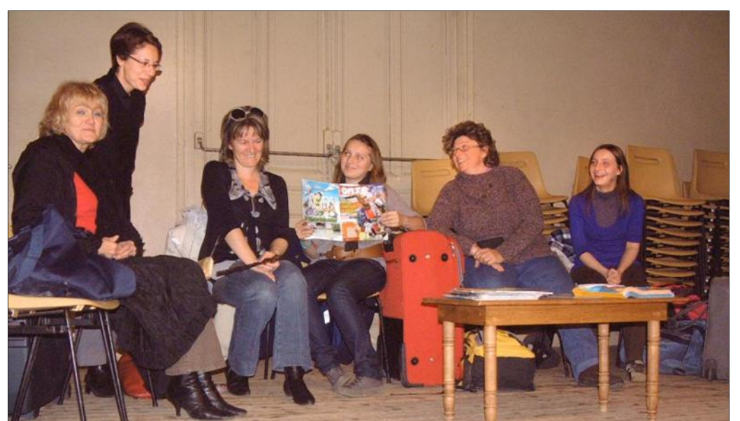
■ Six jeunes femmes talentueuses.

« Embarquement non immédiat », samedi 13 novembre à 20 h 30 et dimanche 14 novembre à 15h, salle des fêtes. Entrée 3 €. Réservations au 03.29.86.61.79 de 18 à 20 h.