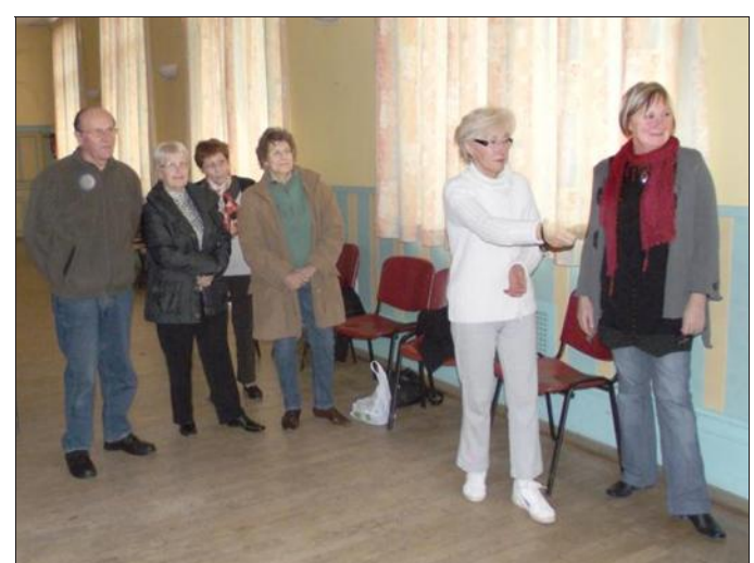
■ Une partie de bowling par télécommande interposée.

parfois des adultes bien mûrs se tenir l'épaule qu'ils ont martyrisée en jouant virtuellement au tennis !