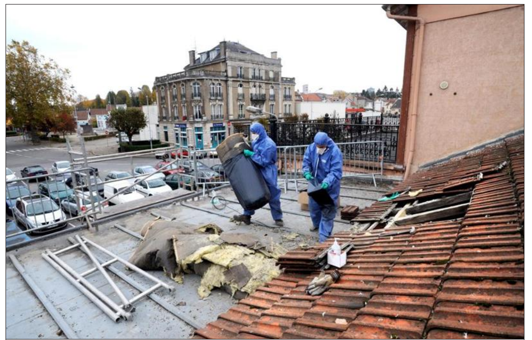
P.L. ■ Les techniciens de LPH utilisent une combinaison de protection.

Ce chantier vient de s'achever et il devrait faire bon cet hiver dans le hall de la gare.