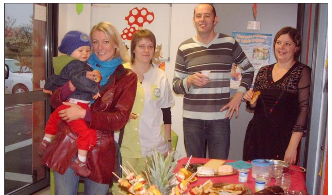
■ Un moment convivial partagé par tous.

Ainsi, une heure durant, parents, enfants et personnel ont partagé un moment convivial autour d'une table bien garnie, ce qui a permis à tous de bien démarrer la journée.