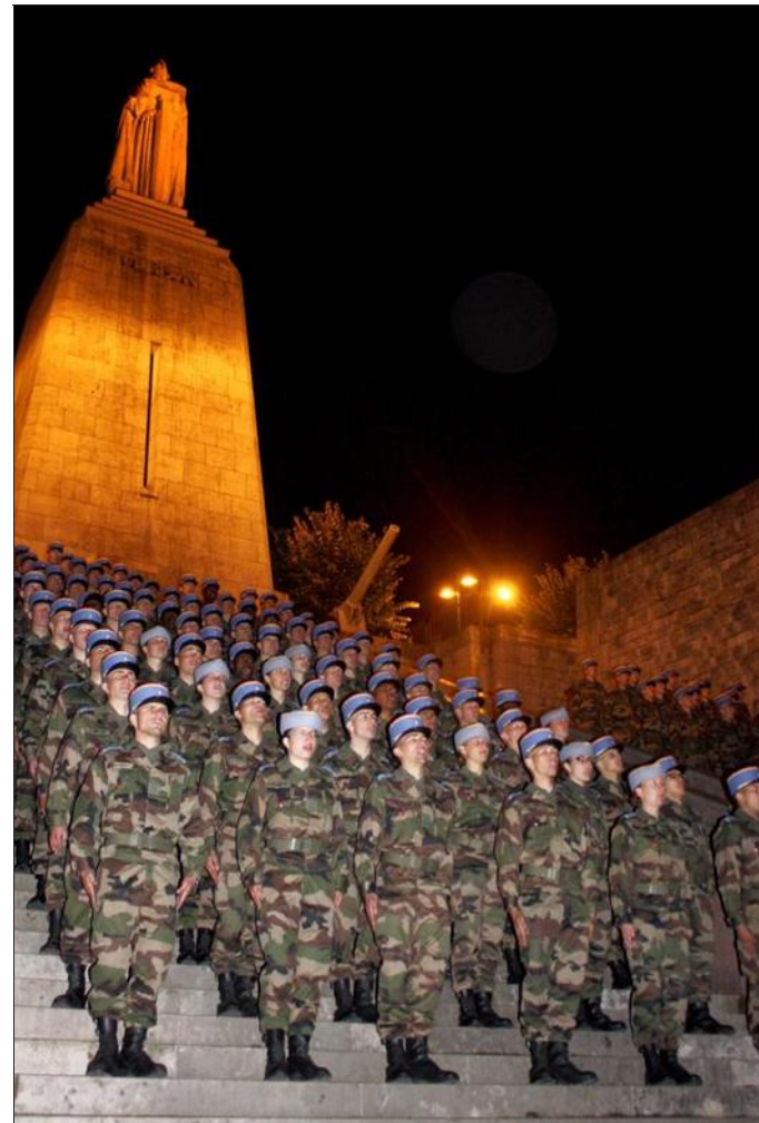
■ Le chant « À Verdun » a résonné avec force au monument À la Victoire.