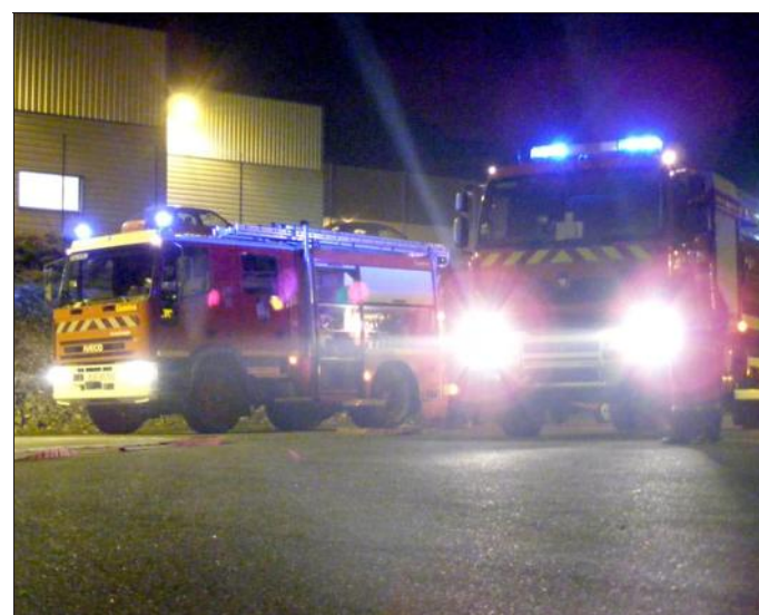
■ La manœuvre permet une meilleure connaissance des lieux.