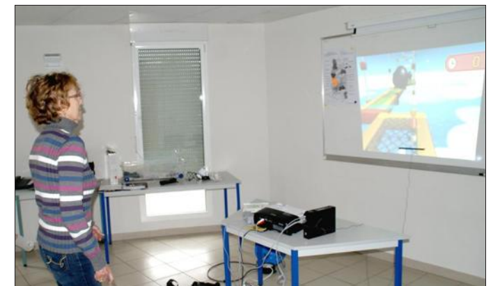
■ Les mouvements se pratiquent en douceur et toujours dans la bonne humeur.

Il est temps de commencer les exercices. Le premier demande agilité et réflexion. Il faut en effet taper « virtuellement » en basculant le bassin de droite à gauche et d'avant en arrière, sur des petits champignons dotés de chiffre pour obtenir le résultat de 10. Calcul mental avec additions et soustractions au programme. Le parcours aé-