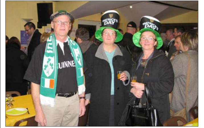
■ Le jour de la Saint-Patrick, les participants prennent soin de porter au moins un vêtement avec du vert, symbole de l'Irlande.

Lors de cette soirée, les participants, qu'ils soient chrétiens ou pas, portent généralement au moins un vêtement avec du vert, assistent à des parades, consomment des plats et des boissons irlandaises. Une belle occasion de se réunir entre amis ou en famille pour passer une agréable soirée où règnent bonne humeur et convivialité.