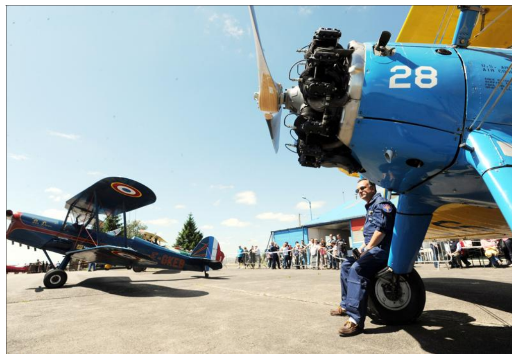
■ Les coucous des Ailes anciennes de Lorraine ont attiré les regards.