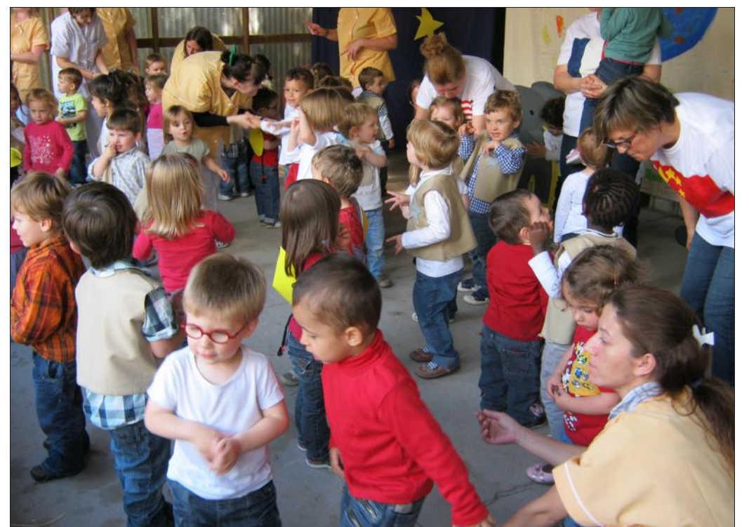
■ Danser tous ensemble, pas évident quand on est petit.

Au terme de près d'une heure de spectacle, l'ensemble des enfants se sont à nouveau tous réunis pour interpréter la chanson finale « Tous les animaux sont nos