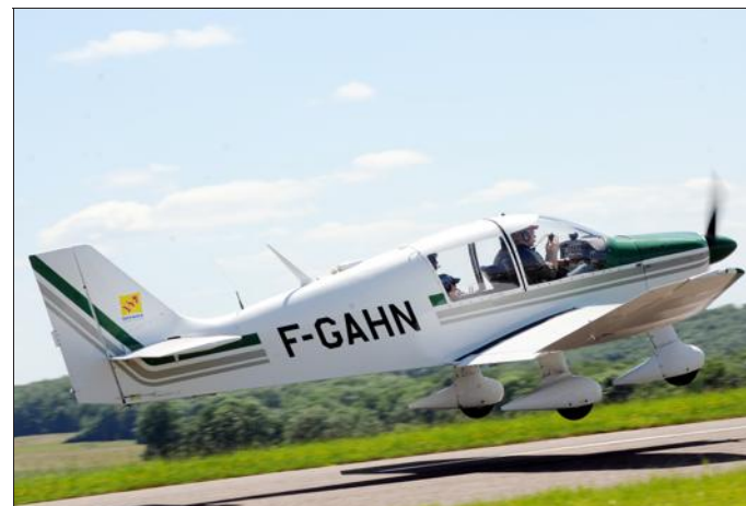
■ Des baptêmes de l'air étaient proposés aux visiteurs.

Ces petits avions de 250 kg aux moteurs de 100 CV ont volé hier dans le ciel verdunois à plus de 300 km/h !