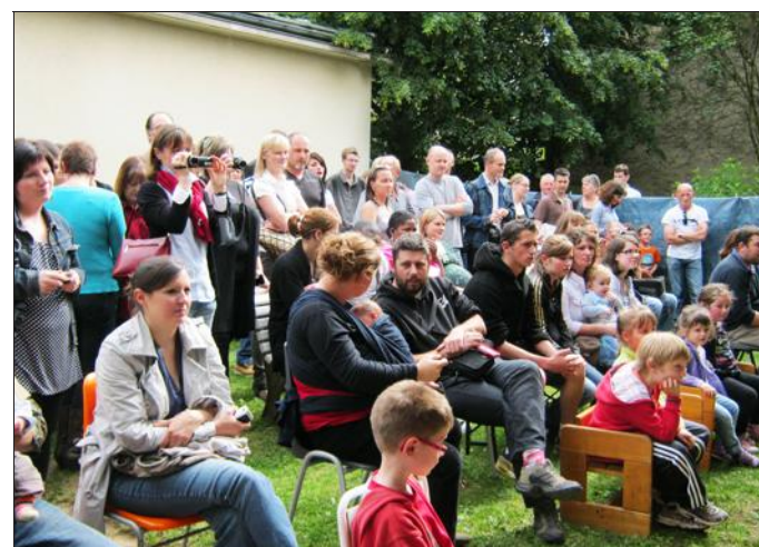
■ De nombreuses familles ont assisté au spectacle.

Afin de clore en beauté la saison, la crèche des Coccinelles offrirait vendredi soir un joli spectacle animé par les enfants et auquel étaient conviées les familles.