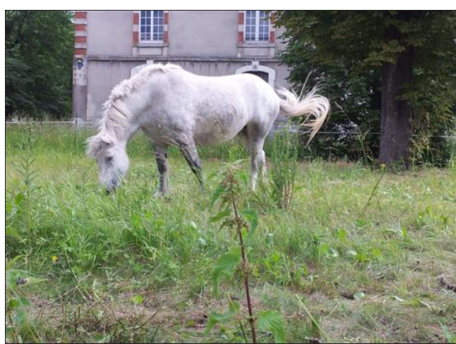
■ Ce beau cheval nettoie efficacement le terrain du quartier Miribel.